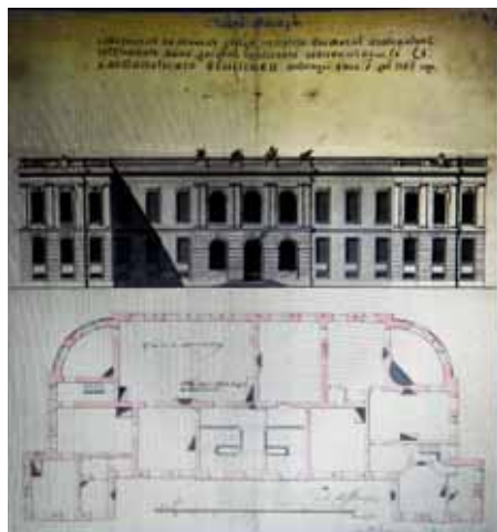
План фасада и здания каменного дворца в Смоленске, утверждённый Екатериной II в 1765 году

примерно там, где сейчас находится Дом Советов — здание правительства Смоленской области. Нужно добавить, что на тот момент ещё не были построены каменные здания, поэтому и губернатор, и наместник занимали также деревянные дома.