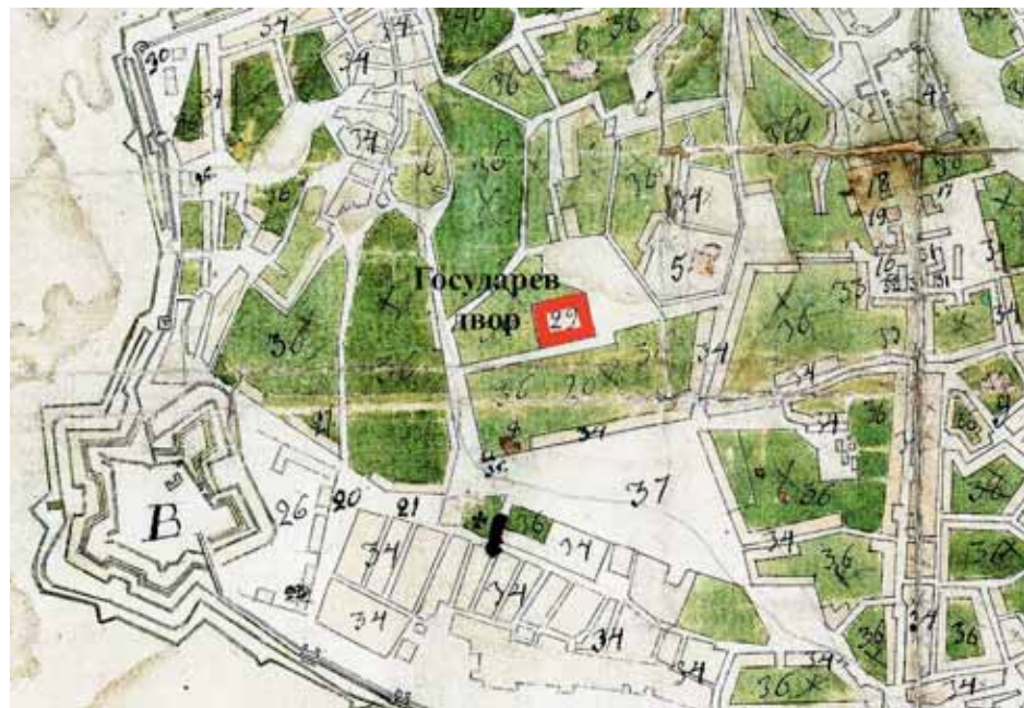
План Смоленска 1781 года с обозначением дома вице-губернатора на территории государева сада, здесь и находился Государев двор. Под № 37 обозначено Блонье (оно ещё частично застроено деревянными домами), под № 5 — Вознесенский монастырь

Ещё в 1765 году, вскоре после вступления на престол, Екатерина II утвердила проект «смоленского каменного дворца», в нижнем апартаменте которого «губернатор жить должен». Сохранился чертёж фасада дворца и его план. Но тогда это здание не было построено. Позднее, в начале XIX века, дом военного губернатора хотели сделать госу-